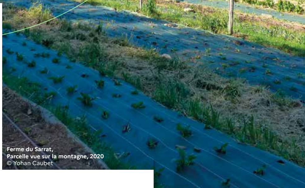
Ferme du Sarrat, Parcelle vue sur la montagne, 2020