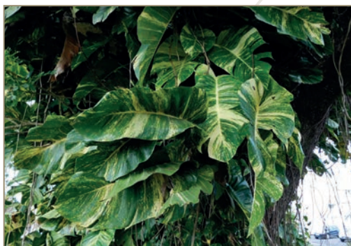
Flemingia spp; Flemingia strobilifera – Sainfoin du Bengale