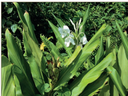
Hedychium coronarium – Hédychie couronnée