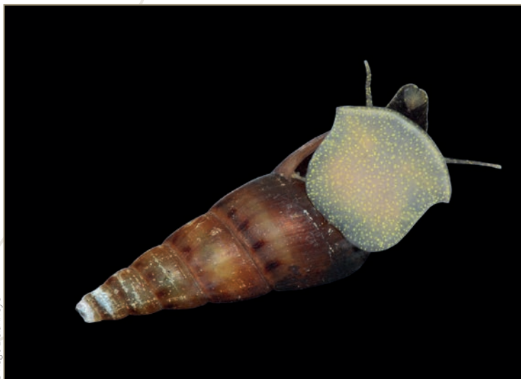
Lissachatina fulica – Achatine