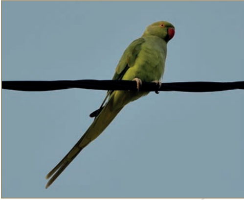
Psittacula krameri – Perruche à collier