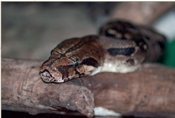
Pythonidae; Python regius – Python royal