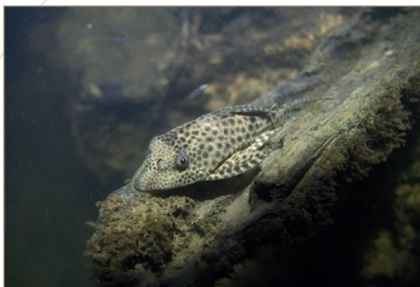
Loricariidae ; Plécos