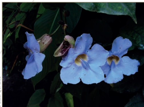
Thunbergia grandiflora – Liane mauve