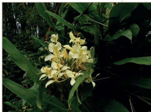
Hedychium gardnerianum – Longose de Gardner