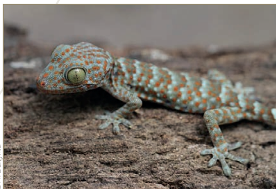
Gekko gekko – Gekko tokay