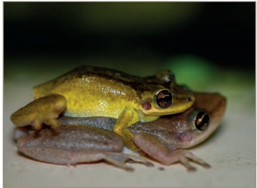
Eleutherodactylus johnstonei – Hylode de Johnstone