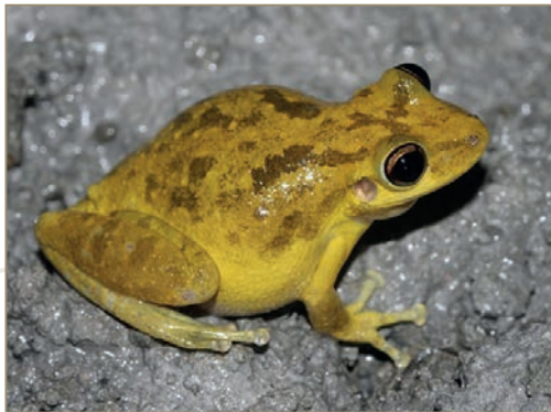
Hylidae; Scinax ruber – Rainette des maisons (mâle et femelle)