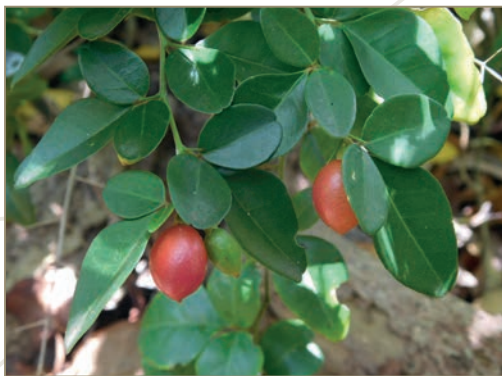
Spathodea campanulata – Tulipier du Gabon