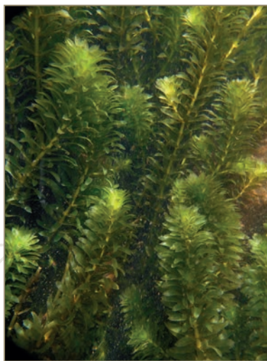
Hydrocharitaceae ; Hydrilla verticillata – Hydrille verticillée