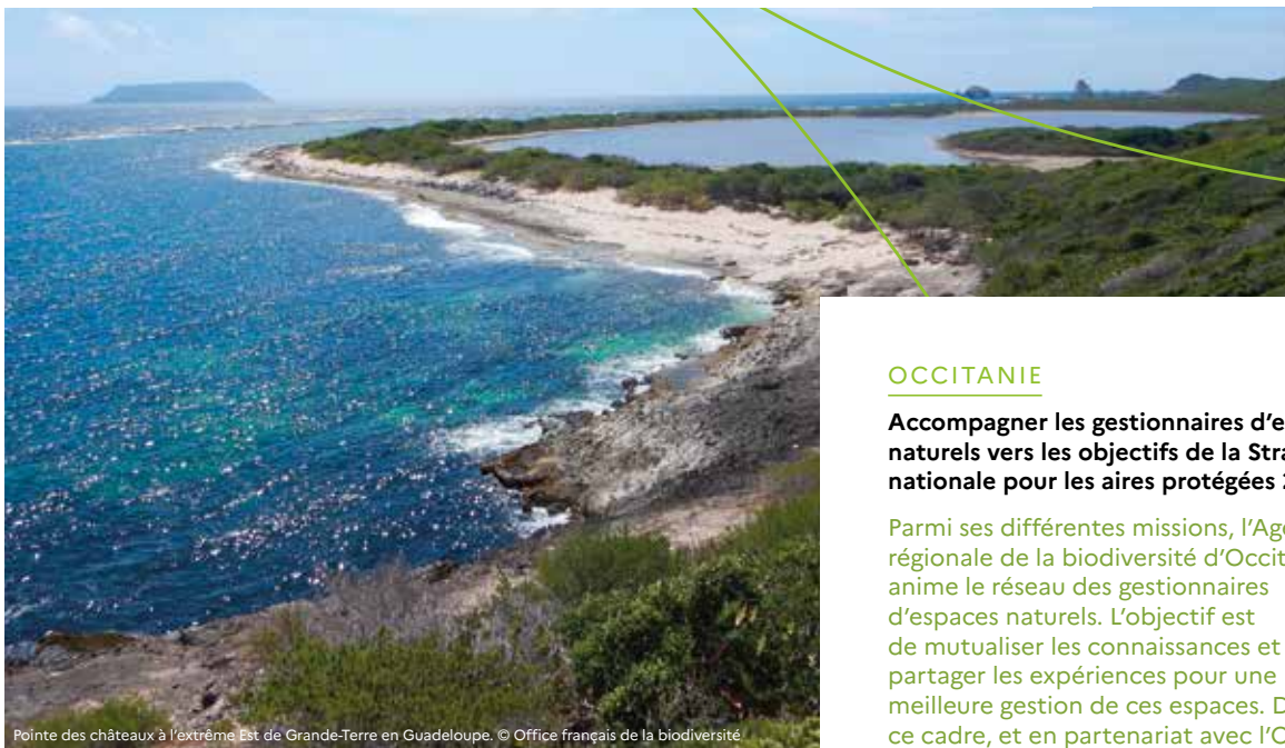
Pointe des châteaux à l'extrême Est de Grande-Terre en Guadeloupe.

Les ARB ont vocation à mener des actions conjointes sans se substituer aux compétences propres de chacun. Elles optimisent les projets et les démultiplient. Les partenaires construisent un plan d'actions, à l'échelle de leur territoire, autour de quatre axes forts.