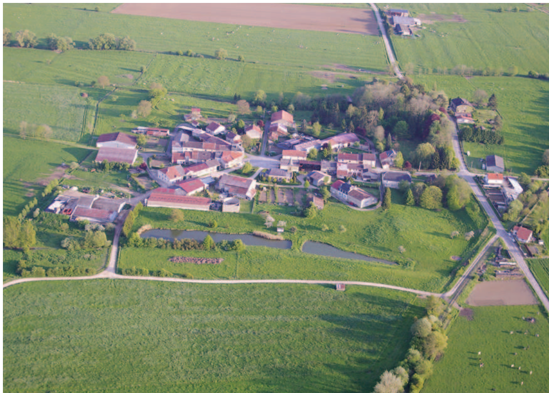
→ Les collectivités rurales sont la cible première d'Aides-territoires (photo : Villefranche - Meuse).