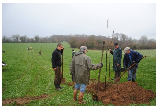
Plantation d'arbres au sein de parcelles agricoles au Pays de Pouzauges.

Le Pays de Pouzauges est marqué par le paysage de bocage, et il offre avec sa chaîne des puits et son riche réseau hydrographique une grande diversité d'habitats naturels. Il n'a cependant pas échappé à la régression des haies bocagères, et la communauté de communes agit résolument pour enrayer cette dégradation. Avec ses communes membres, ses agriculteurs et entreprises, ses habitants et de nombreux partenaires publics et privés, elle anime depuis 2006 une charte forestière et bocagère, support d'un large panel d'actions en faveur à la fois des espèces emblématiques, de la trame verte et bleue et de la valorisation économique et sociale des bois et des haies. Des paiements pour services environnementaux rendus par les bonnes pratiques de gestion sont mis en place sur le territoire, en partenariat avec les partenaires publics et privés. Ces services rendus sont essentiels dans un territoire de têtes de bassins versants avec une topographie marquée : les haies retiennent les eaux de ruissellements et jouent un rôle majeur pour l'accueil de la faune et la connectivité écologique. La création d'un tiers-lieu bois constitué en société coopérative d'intérêt collectif « Les sens du bois » va