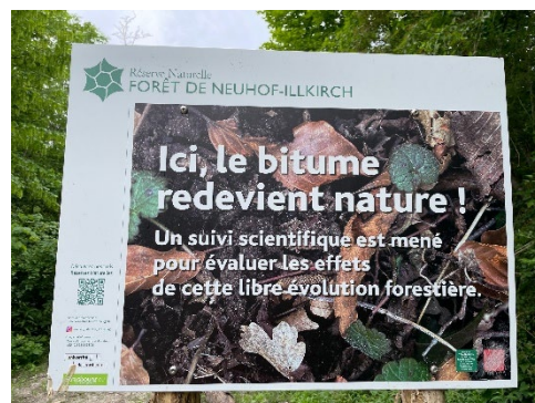
Renaturation de voiries forestières dans la réserve naturelle nationale de Strasbourg-Neuhof / Illkirch-Graffenstaden.

Strasbourg présente la particularité unique d'avoir créé et de gérer 3 réserves naturelles nationales constituées de forêts alluviales périurbaines. Un statut favorable à la protection de la richesse biologique qu'il faut concilier avec les usages, tout particulièrement la promenade et les sports de loisirs, comme dans la forêt de