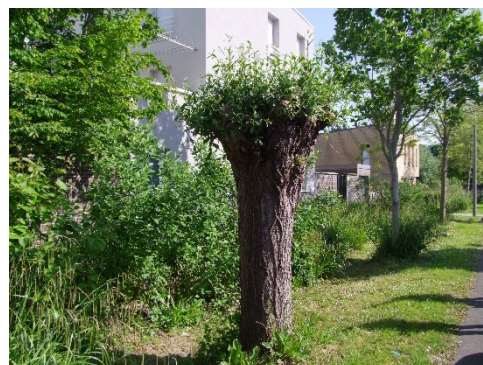
Arbre urbain conduit en têtard à Villeneuve d'Ascq.

Le lien entre arbre et biodiversité est omniprésent dans les actions de Villeneuve d'Ascq, tout particulièrement en ville où aucun projet ne doit générer l'abattage de sujets ou compromettre leur état sanitaire : les plantations comme la gestion prennent systématiquement en compte la cohérence entre paysages et milieux, choix des essences d'arbres et d'arbustes locaux et leurs cortèges d'espèces associées, trame verte et bleue... Elles reposent sur une puissante capacité d'inventaire et de suivis naturalistes.