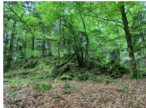
Îlot de sénescence en forêt communale de La Motte-Servolex.

Située au pied du massif de l'Épine, la commune de La Motte-Servolex agit depuis plus de 15 ans pour préserver la biodiversité, notamment dans sa forêt communale de 530 ha où elle a développé avec son gestionnaire, l'Office national des forêts (ONF), un réseau d'îlots de sénescence remarquable de près de 24 ha qui bénéficie d'un suivi scientifique exceptionnel : en plus des suivis forestiers, y compris par les associations naturalistes, ce terrain constitue un objet d'études et de recherche pour l'institut national de recherche pour l'agriculture, l'alimentation et l'environnement (INRAE).