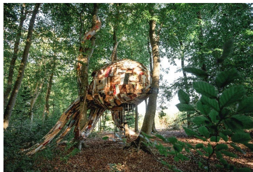
Une des œuvres du festival d'art contemporain Forêt monumentale, organisé par la métropole Rouen Normandie avec l'ONF

La Métropole Rouen Normandie déploie depuis près de 20 ans une palette d'actions d'envergure pour protéger et restaurer le patrimoine forestier, bocager et arboré de son territoire. Sa stratégie de conservation des espaces naturels par acquisition foncière lui a permis de porter à 200 ha la surface de forêt dont elle est propriétaire, complémentaire aux forêts domaniales et de collectivités (60% de forêt publique). Elle anime une Charte forestière de territoire depuis 2002, renouvelée pour la 4e fois en 2021, qui fédère les acteurs de la forêt pour améliorer la connaissance naturaliste, et les pratiques sylvicoles en faveur de la biodiversité, et pour faire connaître au public le milieu forestier, sa richesse et son rôle écologique. Un travail d'éducation à la nature qui s'appuie sur les trois Maisons des Forêts de la métropole mais aussi sur des événements comme le « Bivouac sous la lune » ou le festival d'art contemporain « Forêt monumentale » organisé avec l'Office national des Forêts.