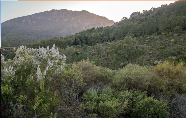
A gauche : Le Golfe de Portu / À droite : Maquis de Flum'Orbu