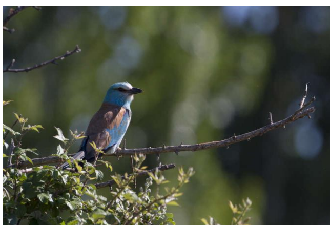
Rollier d'Europe dans la plaine de la Crau (Bouches-du-Rhône)

L'Office français de la biodiversité (OFB) renouvelle son appel à projets « Atlas de la biodiversité communale », en engageant 2 millions d'euros en 2022. Les communes et intercommunalités ont jusqu'au 15 avril pour déposer leur candidature.