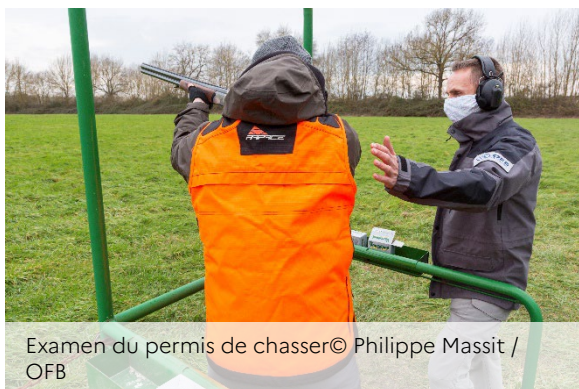
Examen du permis de chasser