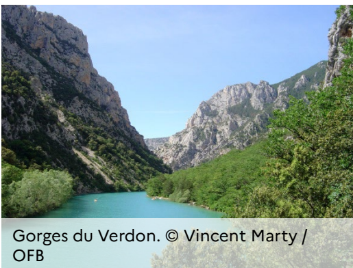
Gorges du Verdon.

Une année exceptionnelle pour la biodiversité dans les territoires : 5 M€ viennent d'être alloués aux collectivités pour financer leur projet d'Atlas de la biodiversité communale (ABC) dans le cadre de l'appel à projets annuel de l'Office français de la biodiversité (OFB). Au total, ce sont 76 projets qui ont été sélectionnés, à l'échelle communale et intercommunale, et seront mis en œuvre prochainement sur tout le territoire, tant en métropole que dans les Outre-Mer.