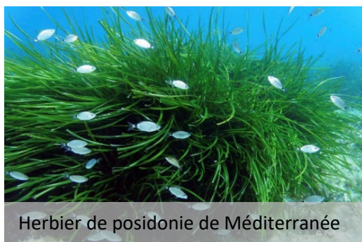
Herbier de posidonie de Méditerranée